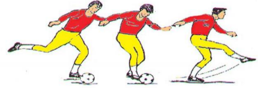
التصويب بوجه القدم الخارص

التهديف بوجه القدم الامامي وبالجزء الخارجي من القدم (أي بالأصبع الصغير)