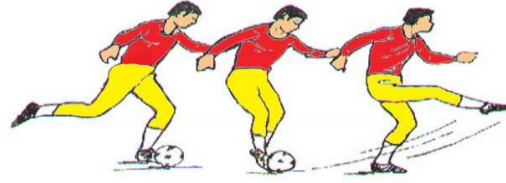
التصويب بوجه القدم الامامي

التهديف بوجه القدم الامامي وبالجزء الخارجي من القدم (أي بالأصبع الصغير)