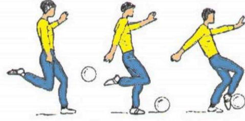
الجرى بالكرة باستخدام وجه القدم الخارص